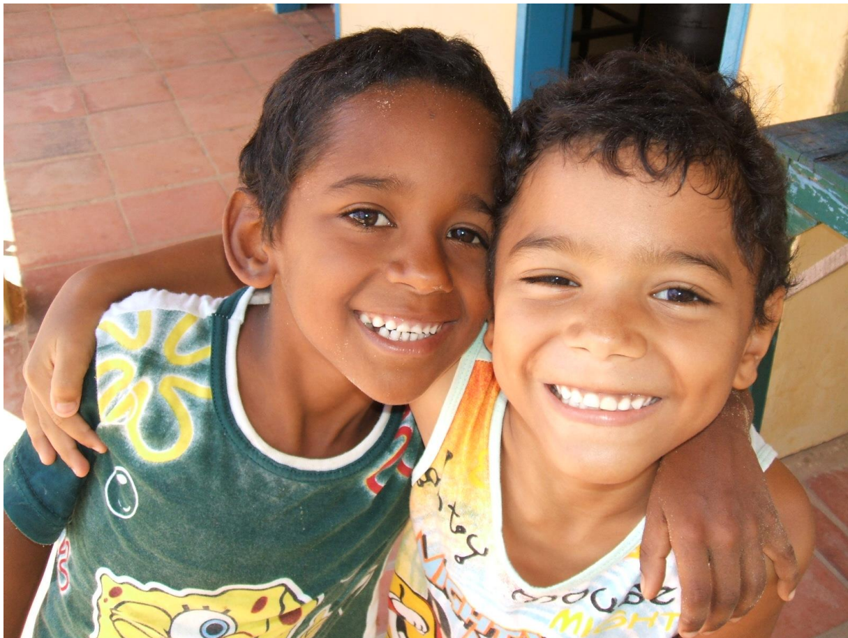
カノア保育園に通っていた頃(右)

光の子どもたちの会やエステーヴァン村を通じて出会ったボランティアの人たち、私の幼少期を支えてくれた先生や同級生たちに心からお礼を言いたいと思います。カノア保育園と学童教室こそ、私が夢をもち、遊び、受け止め、愛された場所だったのだから。